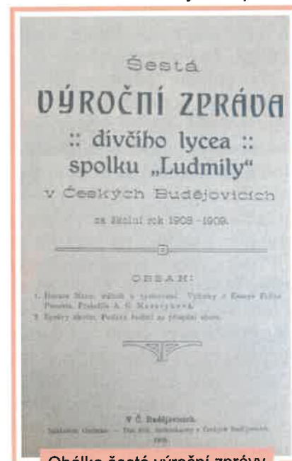
Obálka šesté výroční zprávy dívčího lycea.